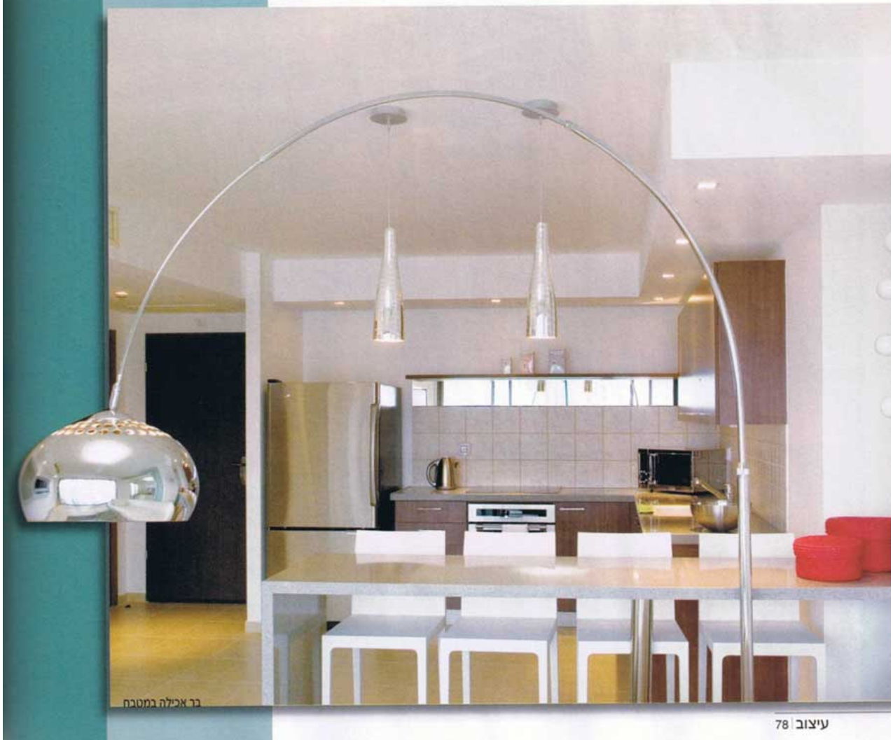
בר אכילה במטבח

בחדר השינה המרכזי נבחרו מנורות לילה אדומות שיתאימו לגב המיטה האדום-יין. גם כאן, משתקפות היאכטות בארון הבגדים שדלתותיו זכוכית. "אולם כאן, השתדלנו להוסיף קצת יותר חום ועל כן נכנס הצבע האדום לתמונה", מספרת האדריכלית. "אותה משיכת מחכול אדומה מתאפיינת בניגועות קטנות בכל הדירה: בשטיחים, במקלחות, בקופסאות הנוי, ובכריות הנוי הפזרות בדירה. ■