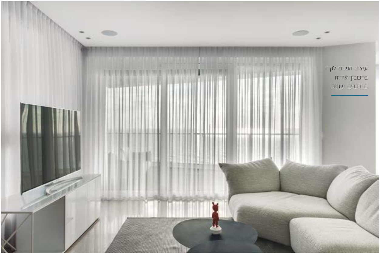
עיצוב הפנים לקח בחשבון אירוח בהרכבים שונים

השפה העיצובית בבית היא אחידה, בעזרת חומרים דומים החוזרים על עצמם בחללים השונים. עץ אלון מופיע גם על רצפת החדרים, מבזיק גם על גופי התאורה השונים ומופיע גם במטבח הנקי